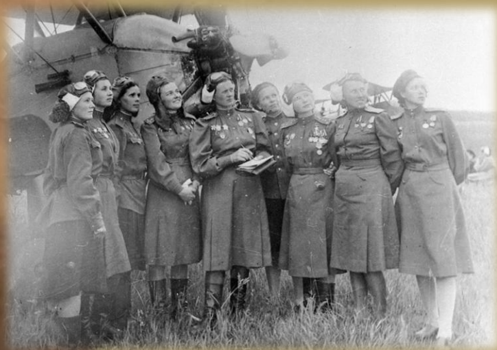
Летчицы 46-го гвардейского авиационного полка

Что касается летчиц, то у нас было три женских авиационных полка: 586-, 587- и 588-й. 588-й впоследствии (в феврале 1943 года) был переименован в 46-й Гвардейский Таманский полк. Летчиц именно этого полка немцы прозвали «Ночными ведьмами». Указ об их создании вышел 8 октября 1941 года. Это произошло благодаря известной летчице Марине Михайловне Расковой, которая уже на тот момент была Героем Советского Союза и обратилась непосредственно к Сталину с таким предложением.