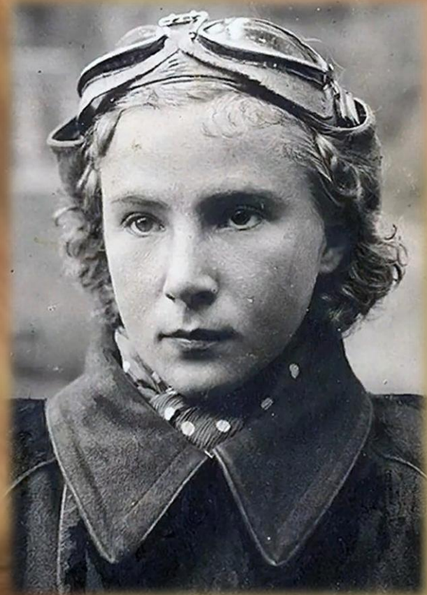
Лидия Владимировна Литвяк

Среди женщин, пилотировавших истребители, одна из самых известных – это Лидия Литвяк, которую называли «Белая лилия Сталинграда». Она вошла в историю как самая результативная женщина-истребитель: на ее счету было 16 побед – 12 личных и 4 групповых.