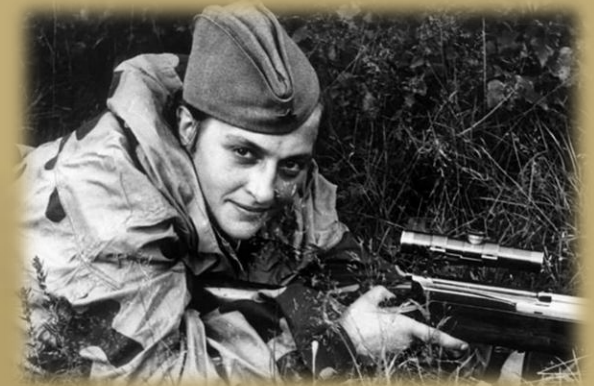
Павличенко Людмила Михайловна