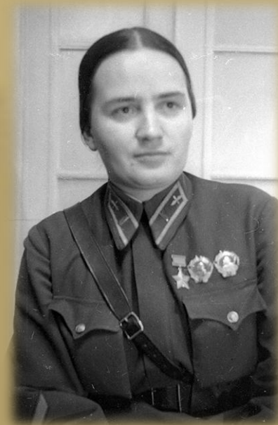
Марина Михайловна Раскова