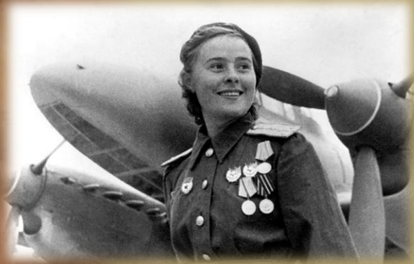
Долина Мария Ивановна