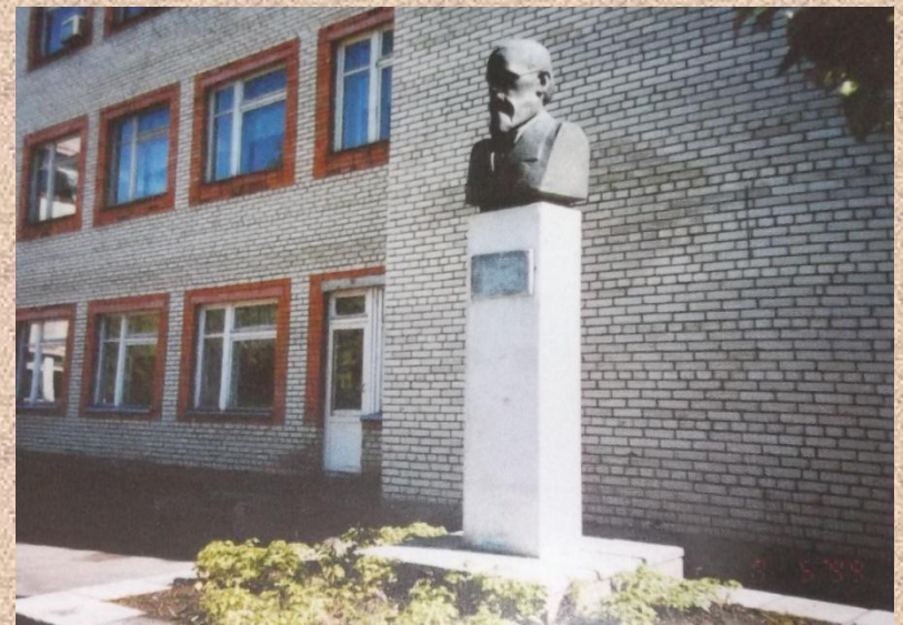
Памятник В.О. Ключевскому у школы на родине в с. Воскресеновке