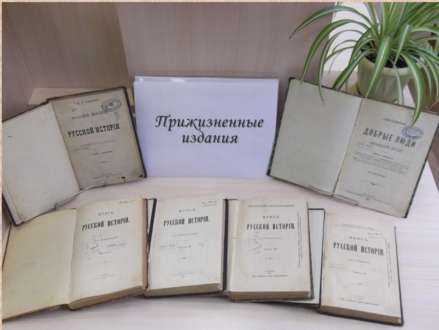
Из фонда редкой книги библиотеки педагогического института им. В.Г. Белинского