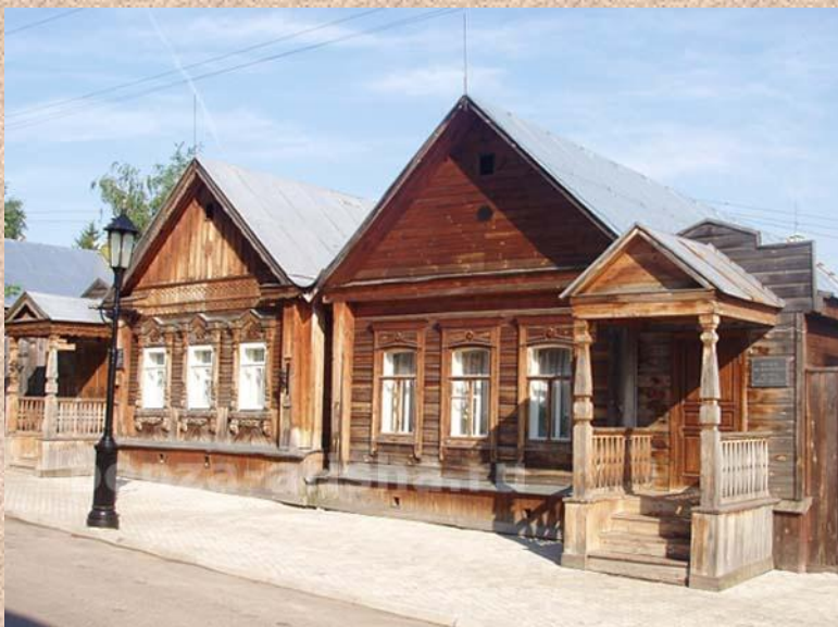
Дом-музей В.О. Ключевского в Пензе, где прошли его детские и юношеские годы

1991 – выпущена почтовая марка СССР, посвященная Ключевскому.