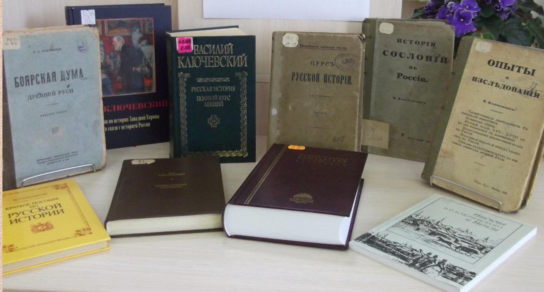
Книги из фонда библиотеки педагогического института им. В.Г. Белинского