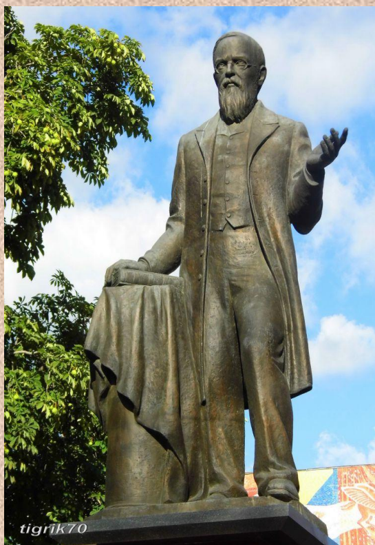
Памятник В.О. Ключевскому в Пензе

2011 – почта России выпустила памятные почтовый конверт с изображением музея Ключевского и открытку с изображением памятника В.О. Ключевскому со специальным